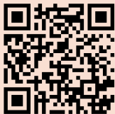
Bösel youtube Kanal

Sehr gerne informieren wir Sie auch mit unserem Newsletter. Wir freuen uns, wenn Sie ihn abonnieren: https://newsletter.boesels.at/neues-inspirierendes/neues-von-den-boesels