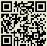
Bösel youtube Kanal