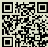
Bösel youtube Kanal